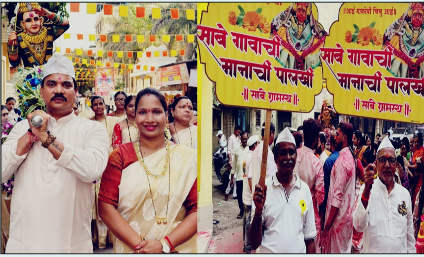
ठाणे : दिव्यातील सावेगावची आई गावदेवी चिचूआईचा ३ रा वर्धापनदिन सोहळा मोठ्या उत्साहात संपन्न झाला. देवीची महापूजा, अभिषेक व महाआरती व सायं ४.३० ते ९ वा. - आईचा पालखी सोहळा रात्री महाप्रसादाचे आयोजन करण्यात आले होते. प्रसंगी सावे ग्रामस्थ मंडळाच्या वतीने सर्वाना आमंत्रित करण्यात आले होते.

कर्मचाऱ्याला त्याच्या हक्काचा पैसा देऊ शकत नसेल, तर मंत्रालयासमोर किंवा गेट वे ऑफ इंडिया येथे आमच्या समाध्या बांधा, अशी संतप्त मागणी त्यांनी केली आहे. हे पत्र मुख्यमंत्री कार्यालय, बृहन्मुंबई महानगरपालिका, बेस्ट प्रशासन तसेच संबंधित वरिष्ठ अधिकार्यांना पाठविण्यात आले आहे. दरम्यान, बेस्टमधील निवृत्त कर्मचाऱ्यांचे रखडलेले देयके, अपुर्ण पेन्शन आणि आर्थिक अडचणी यामुळे अनेक कुटुंबे संकटात असल्याची चर्चा पुन्हा रंगू लागली आहे. एका निवृत्त कर्मचाऱ्यांच्या पत्नीचा हा आक्रोश आता केवळ एका कुटुंबाचा प्रश्न राहिलेला नसून, संपूर्ण व्यवस्थेसमोर उभा राहिलेला मानवी संवेदनांचा प्रश्न बनला आहे.